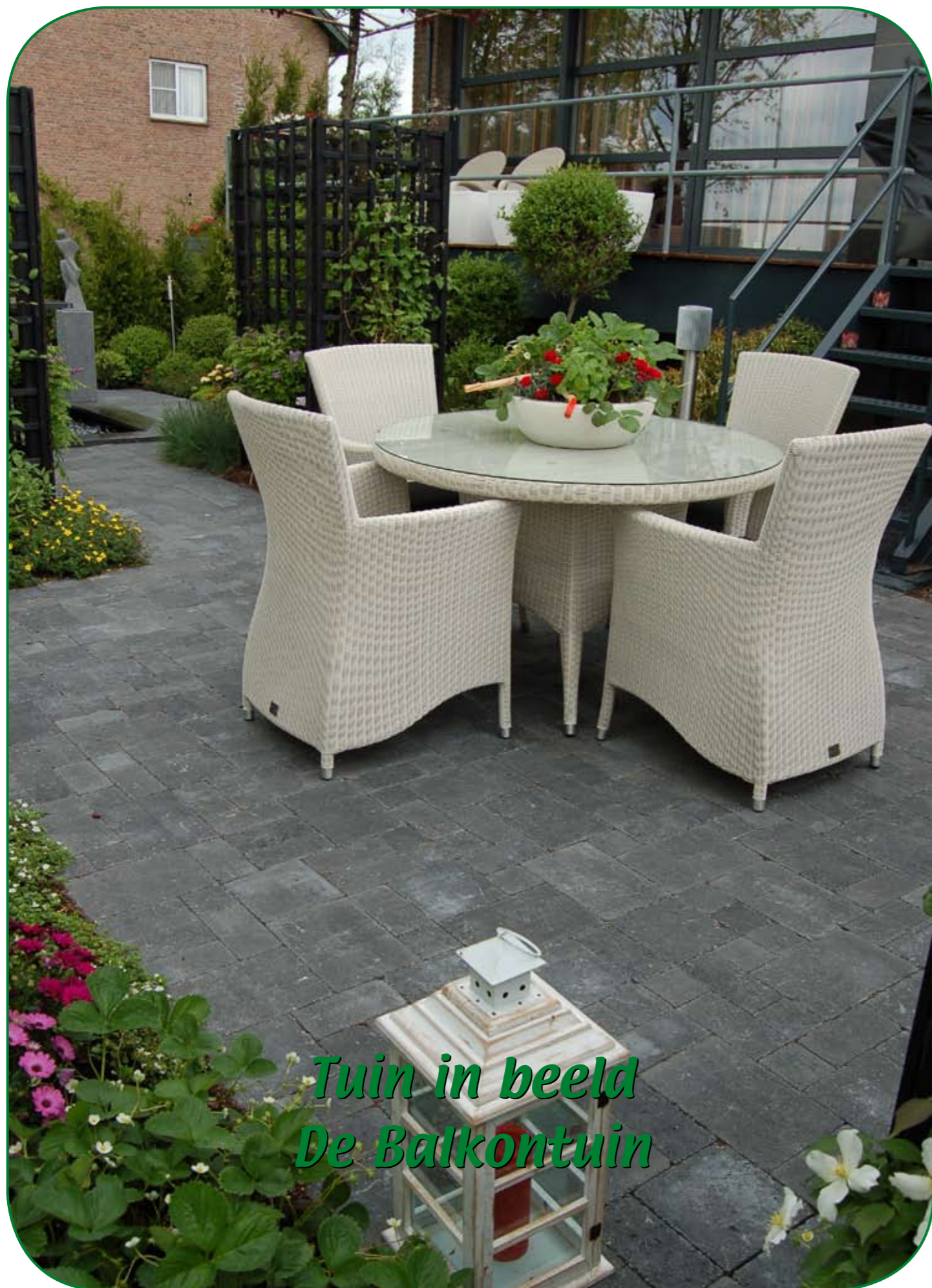
Tuin in beeld De Balkontuin

Dit voormalige bedrijfspand is door de huidige bewoners verbouwd tot een prachtige vrijstaande woning. De afgesloten tuin is alleen bereikbaar via het balkon aan de voorzijde van de woning. Dit gaf ons de gelegenheid om het balkon bij de tuin te betrekken. Als bestrating hebben we in deze tuin de Tambourisés Paquet wildverband stenen in de kleur zwart gebruikt. Deze zwarte kleur komt ook terug in de bielsen, de trellisschermen waar rozen doorheen groeien en het balkon. Hierdoor ontstaat een harmonieus geheel dat goed contrasteert met de witte meubelen in de tuin en op het balkon. Deze nieuwe 'voortuin' ligt langs een doorgaande openbare weg en