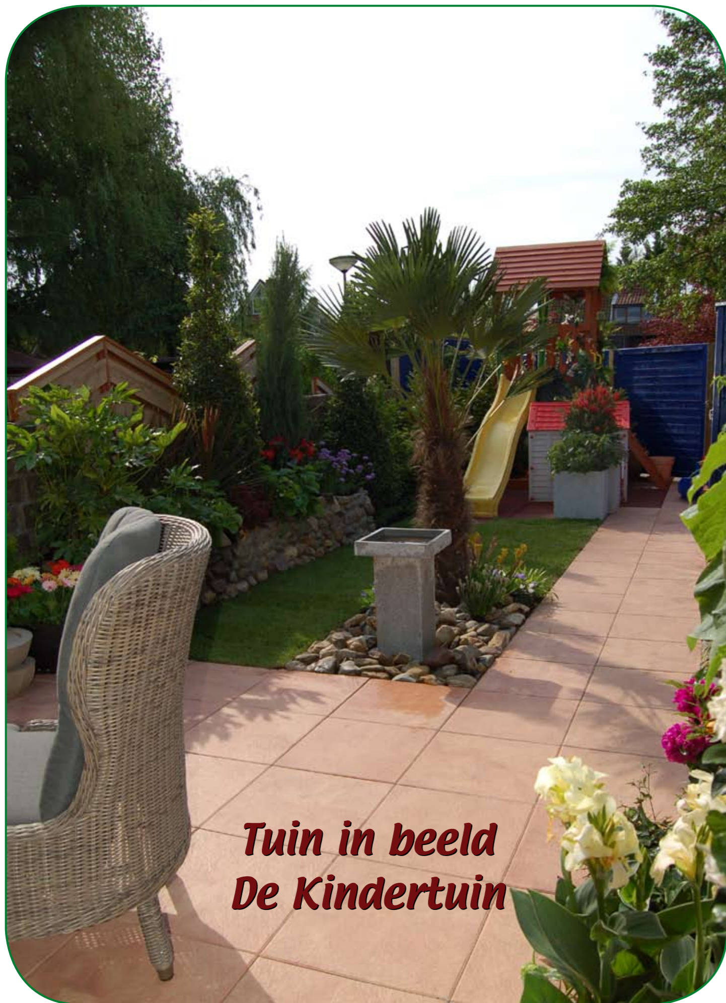
Tuin in beeld De Kindertuin

Een tuin waarin veel leefruimte aanwezig moest zijn voor een jong gezin met Afrikaanse roots. Op basis van deze achtergrondinformatie hebben we een tuin ontworpen waarin het Afrikaanse element in de tuin terug komt dankzij exotische beplanting en warme kleuren in de tegels. Als bestrating hebben we hier gekozen voor een levendige, gecoate tegel uit de Vulcan Line. De geel/rood gevlamde kleur van de tegel voldoet aan de exotische sfeer. Dankzij de coating zijn deze tegels ook nog eens onderhoudsvriendelijk; een prettige bijkomstigheid voor een gezin met twee kleine kinderen. Om de zuidelijke sfeer te benadrukken is onder meer gekozen voor beplanting met palmen en cypressen. Beide boomsoorten zijn zeer geschikt om in het Hollandse klimaat te planten.