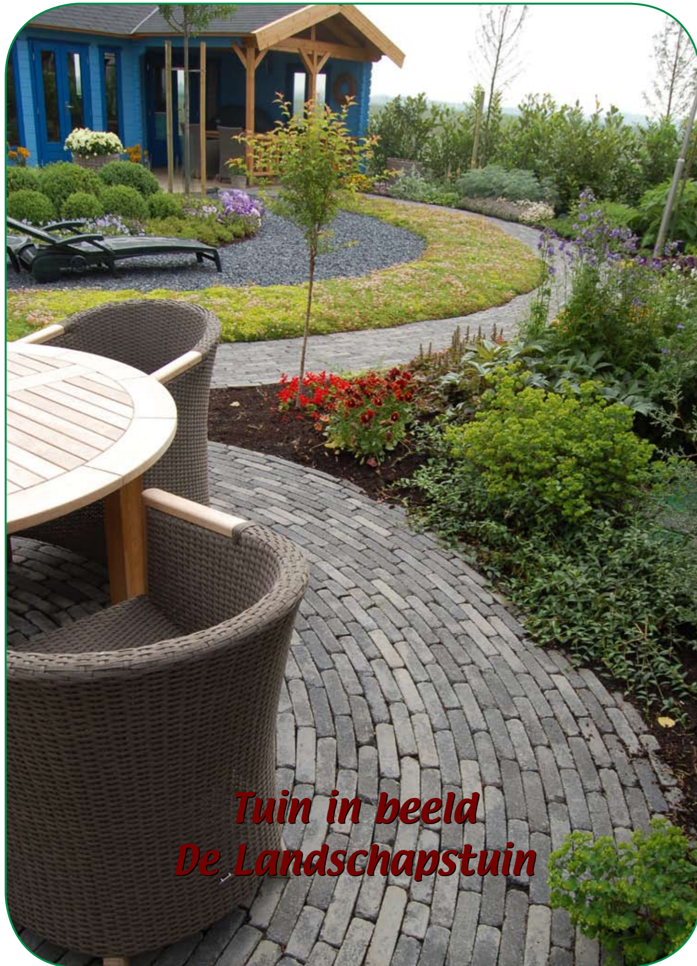
Tuin in beeld De Landschapstuin

Een grote tuin met volop ruimte en vrij uitzicht op de omringende landbouwgronden. De locatie zelf is al prachtig. De eigenaren van deze tuin wilden het vrije uitzicht uiteraard behouden en ze wilden weinig onderhoud plegen aan de buitenruimte. Ook wilden ze de tuin het liefst aanpassen aan de natuurlijke omgeving. Aan al deze wensen hebben we kunnen voldoen. In het ontwerp is gekozen voor een tuin in een landschappelijke stijl, maar wel met moderne invloeden door de kleurkeuze. Als bestrating hebben we gekozen voor de Retrostones in de kleur Foney grijs/zwart. Deze langwerpige waalformatstenen laten zich gemakkelijk in gebogen en ronde vormen straten. Deze stenen zijn uitermate geschikt om in een landschapstuin toe te passen.